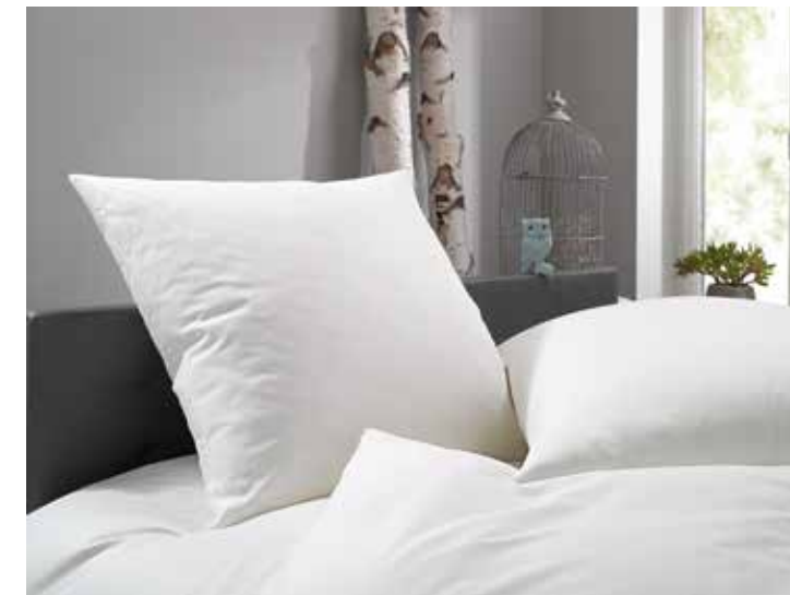
Toscana 2 mm Streifen Mako Satin 100% Baumwolle