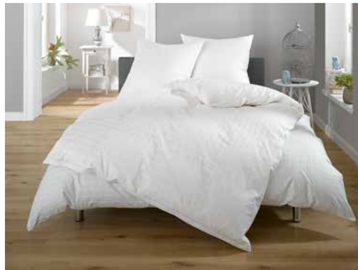
Tirol Karo Mako Batist 100% Baumwolle