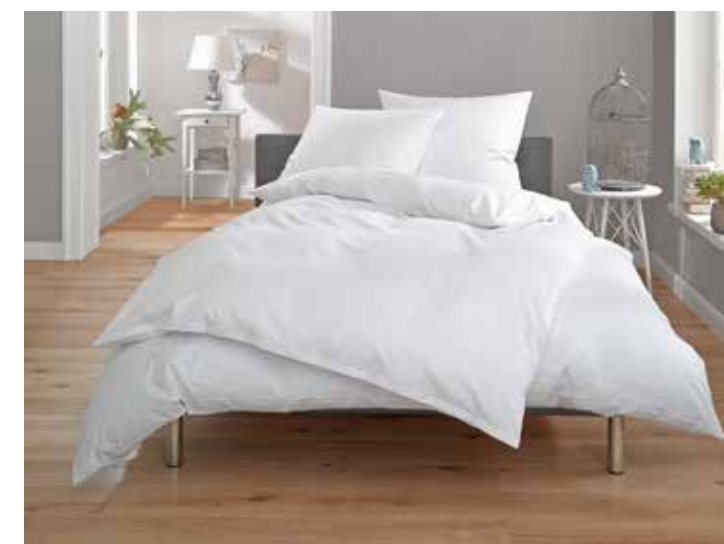
Toscana 10 mm Streifen Mako Satin 100% Baumwolle